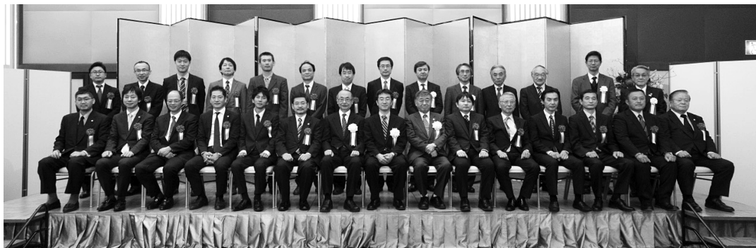
飯田・中小企業庁経営支援課長，福田・当協会会長，審査委員ならびに表彰者の方々

また、「表彰式」終了後には，17時30分より「懇親会」が開催され，論文発表者をはじめ，当協会