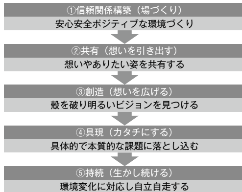
図表3 パートナー型コンサルティング・プロセス