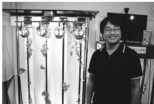
東京支店に展示している縦型水耕栽培装置

ある時、栽培された農作物を収穫しきれないという問題が発生した。その結果、単に未収穫分が販売できないだけでなく、ビニールハウス内の農作物の密度が想定を超えて高くなり、湿気を適正に保てなくなり、病気の発生などビニールハウス全体に悪影響を及ぼす可能性が高くなってしまった。