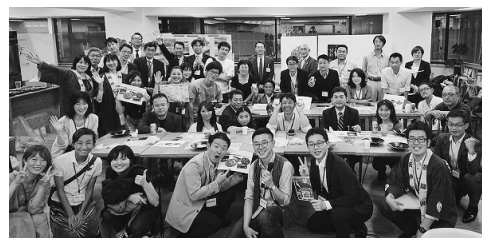
第1回ミートアップの集合写真

魅力的な料理やお酒の助けもあるが、ターゲットを絞った集客により南伊豆町に対して熱い気持ちや目的意識を持った方が集まったところが大きかったように感じる。